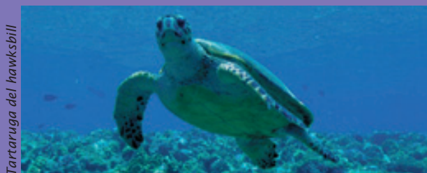
Tartaruga del hawksbill

Il turismo non è stato sviluppato volutamente dato che la tutela della fauna selvatica dell'isola costituisce l'unico obiettivo della riserva. Aride non ha fini di lucro. I diritti di sbarco nonché le donazioni di fautori e altri organismi contribuiscono alla conservazione del parco nazionale in cui si è trasformata, consentendole di garantire l'arricchimento a lungo termine delle acque e dei cieli dell'Oceano Indiano.