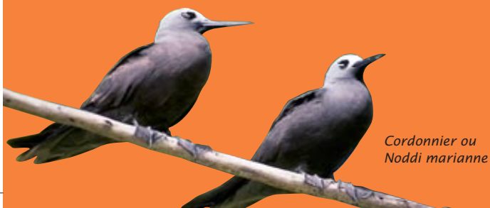
Cordonnier ou Noddi marianne

Aride est la plus importante réserve d'oiseaux des Seychelles. On y trouve plus de 750 000 couples de dix espèces d'oiseaux marins nicheurs, plusieurs milliers de frégates et cinq espèces d'oiseaux terrestres endémiques des Seychelles dont la très rare Pie chanteuse.